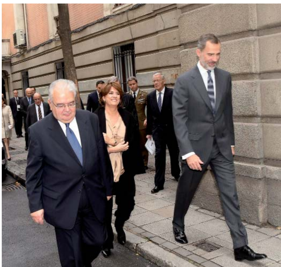
El Rey, la ministra y el presidente del Tribunal Constitucional