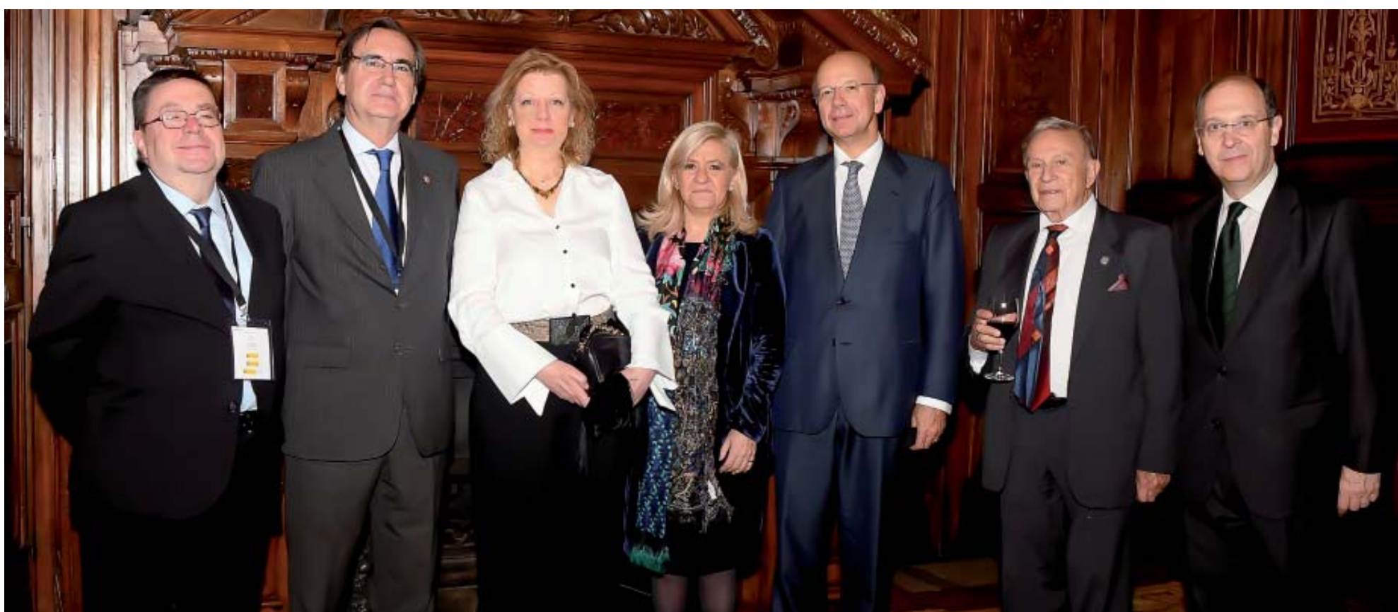
Un grupo de congresistas durante la recepción celebrada en el Palacio de Linares