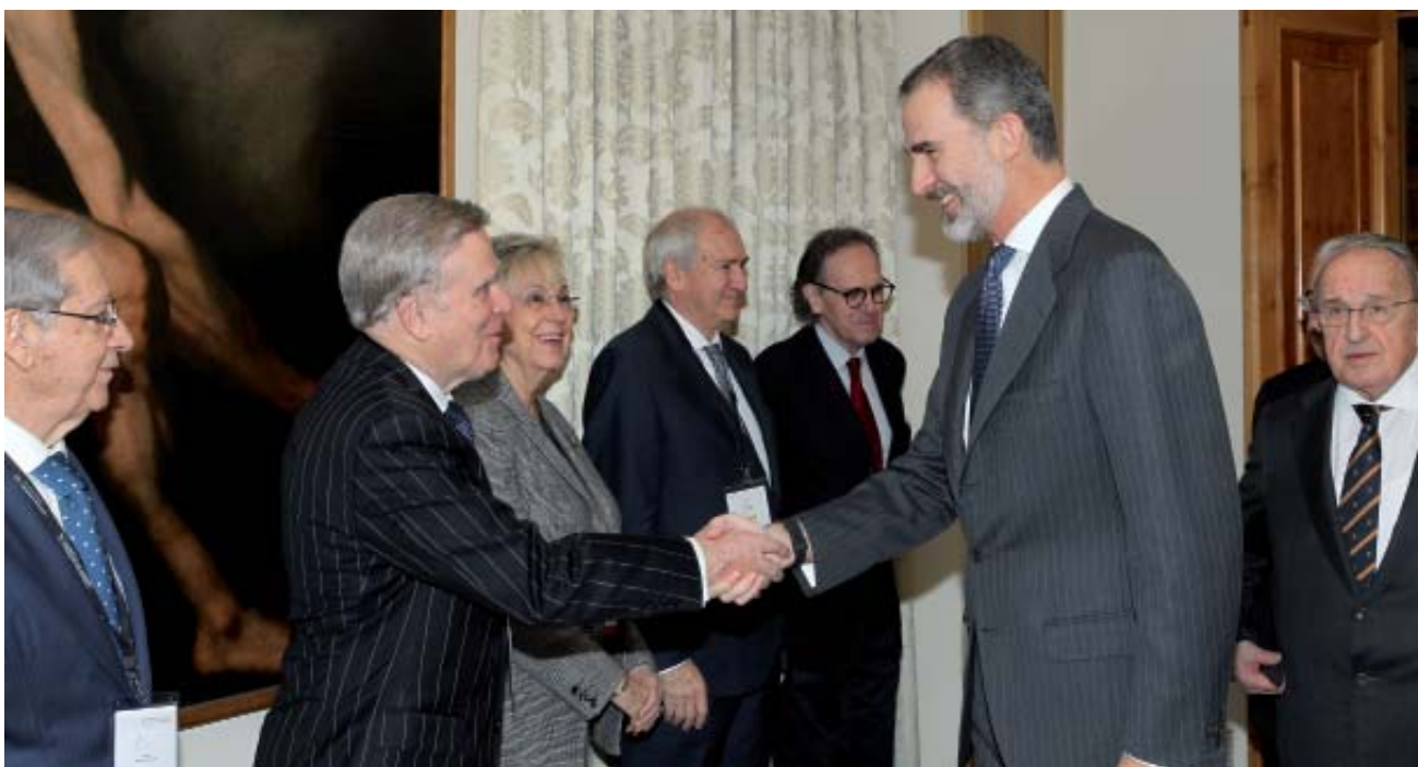
Su Majestad El Rey saludando a miembros de la Junta de Gobierno de la Real Academia de Jurisprudencia y Legislación de España