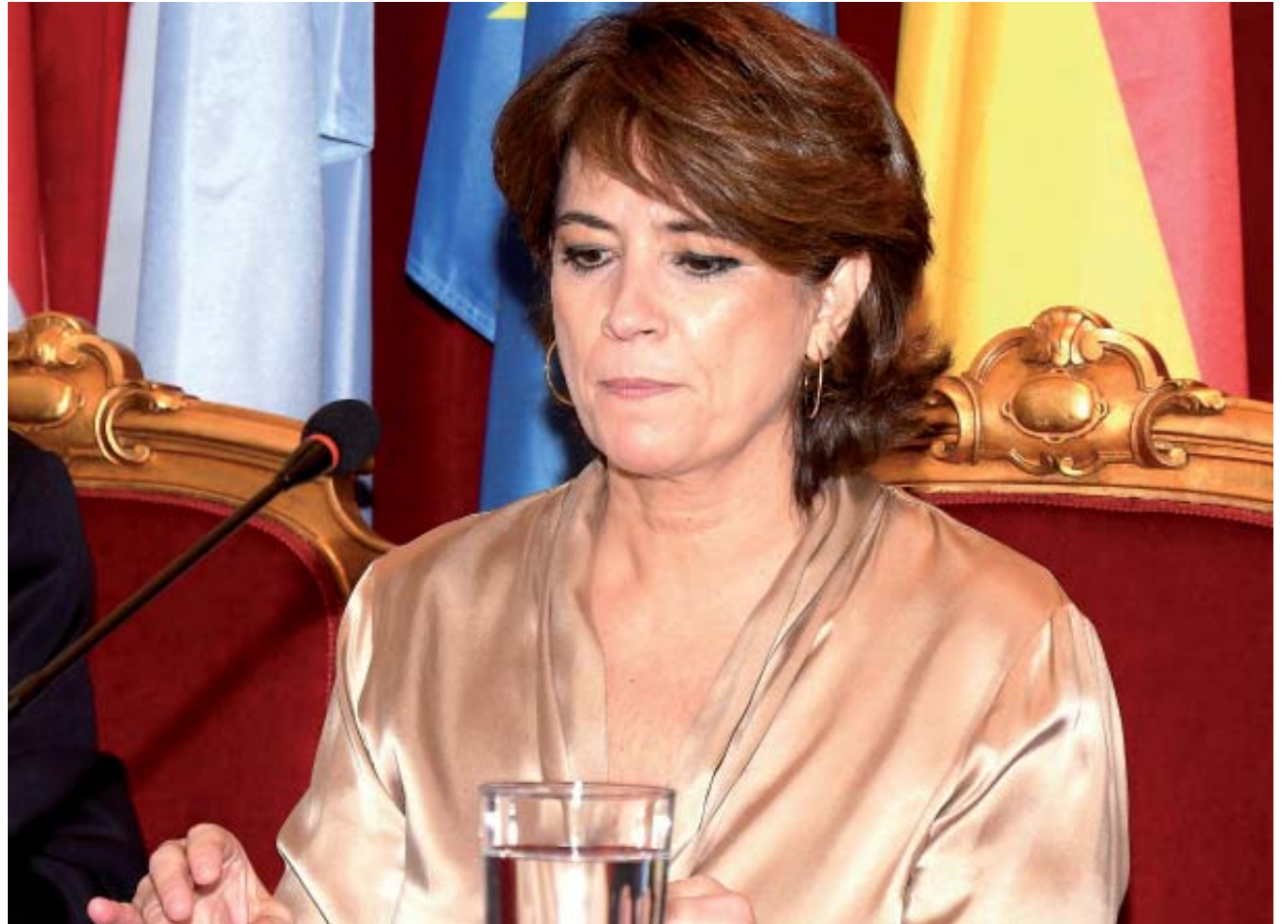
La ministra de Justicia, Dolores Delgado, en un momento del acto inaugural del X Congreso de las Academias Jurídicas de Iberoamérica

“Ejemplo extraordinario de acuerdo, la Carta Magna se ha demostrado un instrumento útil para asegurar la convivencia de los españoles”