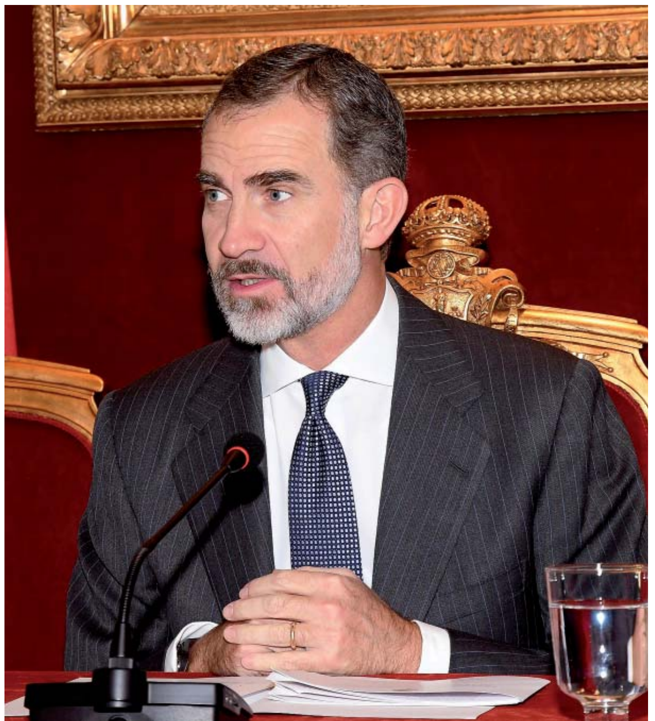
Su Majestad Felipe VI en un momento de su discurso de inauguración del X Congreso de las Academias Jurídicas de Iberoamérica

El monarca destacó asimismo el papel de los juristas de Iberoamérica en su contribución a la construcción del cuadro fundamental de los derechos humanos, impulsando su progreso y su consolidación, una tarea que calificó como inagotable. Felipe VI apuntó que el mundo jurídico iberoamericano ha de sostener