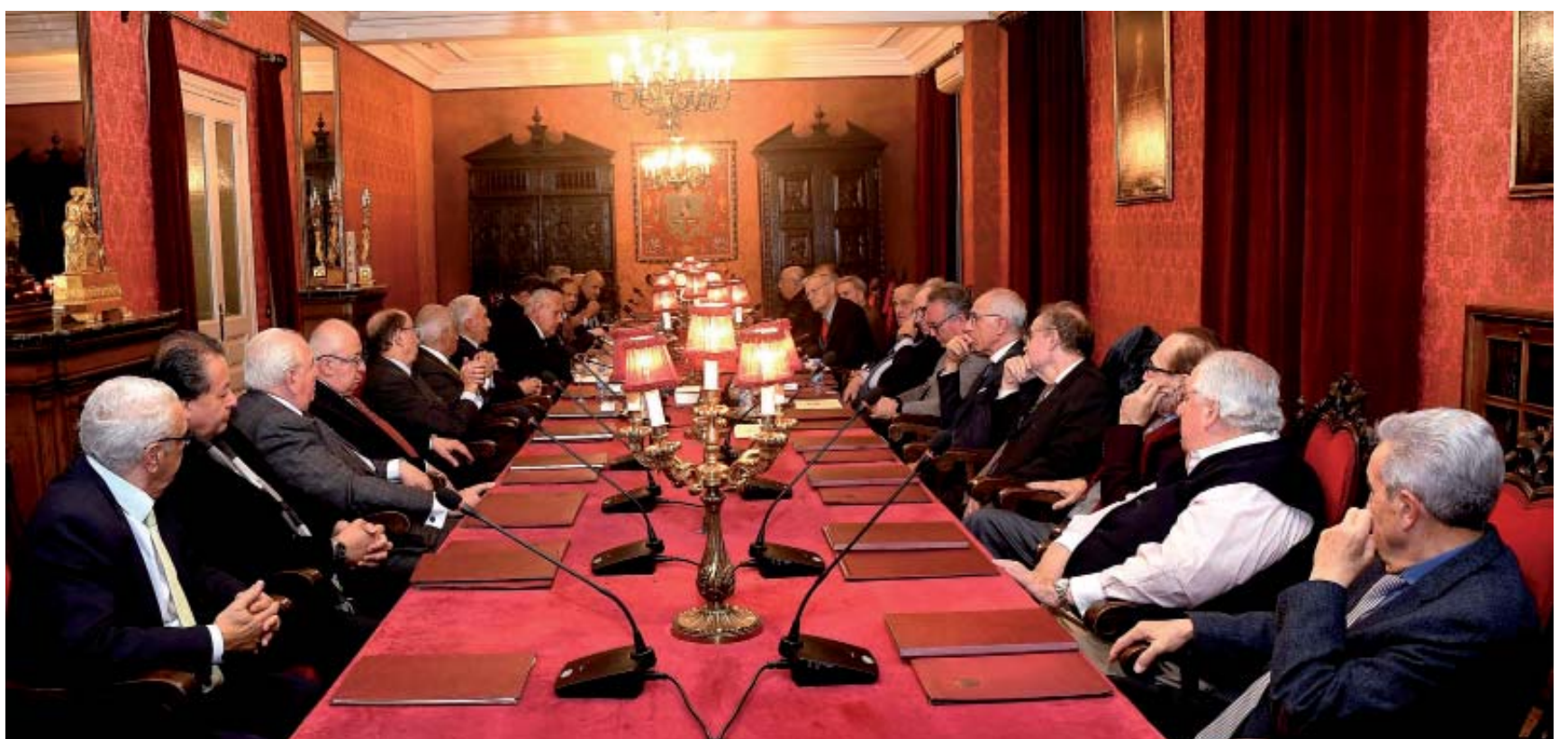
Abajo, mesa del Consejo de Delegados de la Conferencia Permanente de las Academias Jurídicas de Iberoamérica celebrado durante el X Congreso

La Mesa Permanente es ahora la "Comisión Ejecutiva" de la Conferencia Permanente