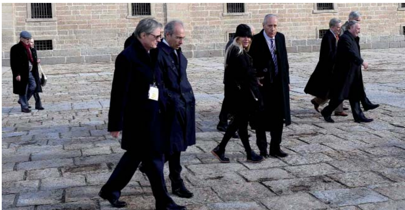
Camino del Centro Universitario María Cristina