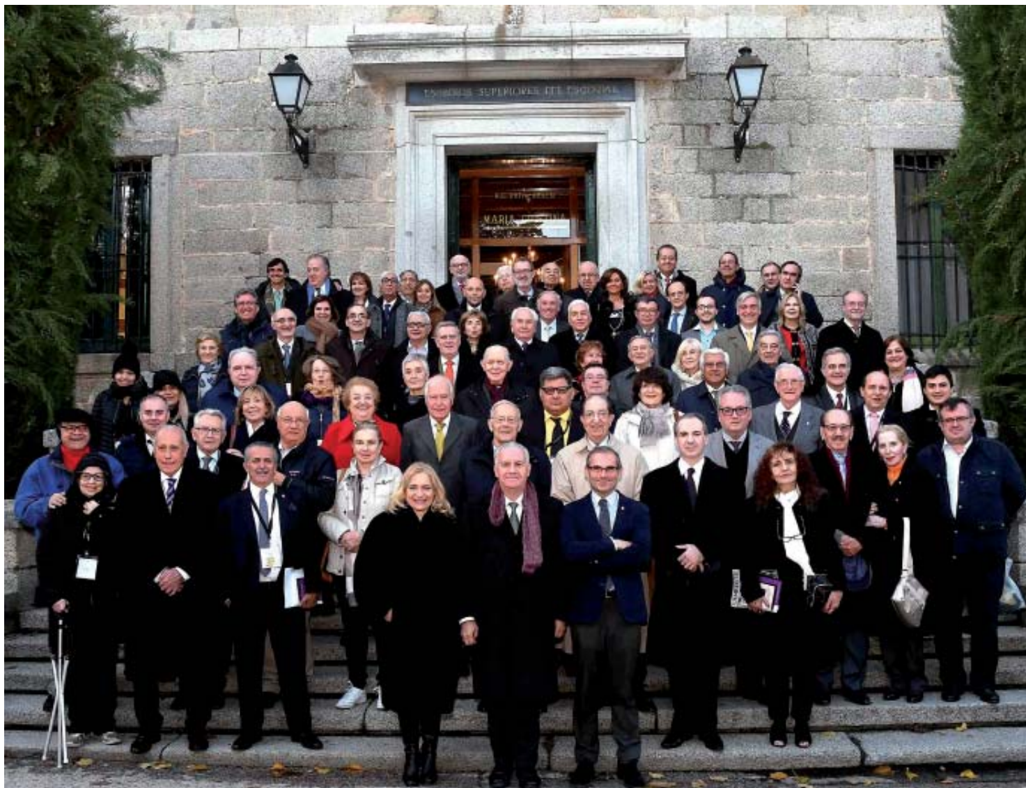
Foto de familia de los académicos que visitaron el Monasterio de San Lorenzo de El Escorial; visita incluida en los actos paralelos al X Congreso de las Academias Jurídicas de Iberoamérica celebrado en la sede de la RAJYL, en Madrid