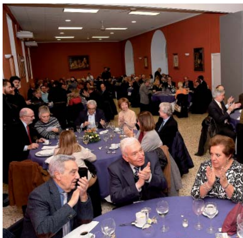
Vista de una de las mesas durante el almuerzo ofrecido por el Centro María Cristina