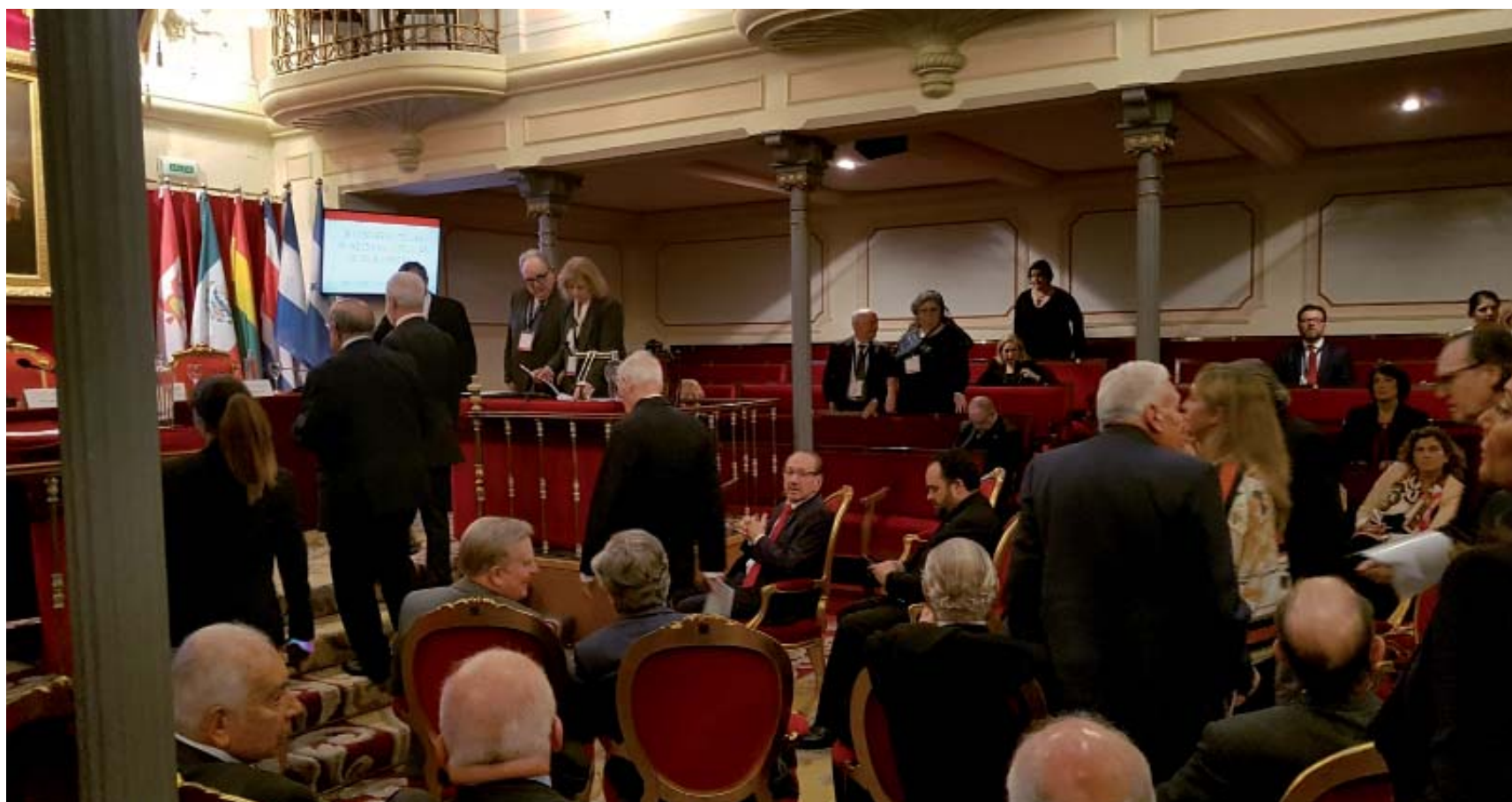
Salón de Plenos momentos antes de que dé comienzo el acto de clausura del X Congreso de las Academias Jurídicas