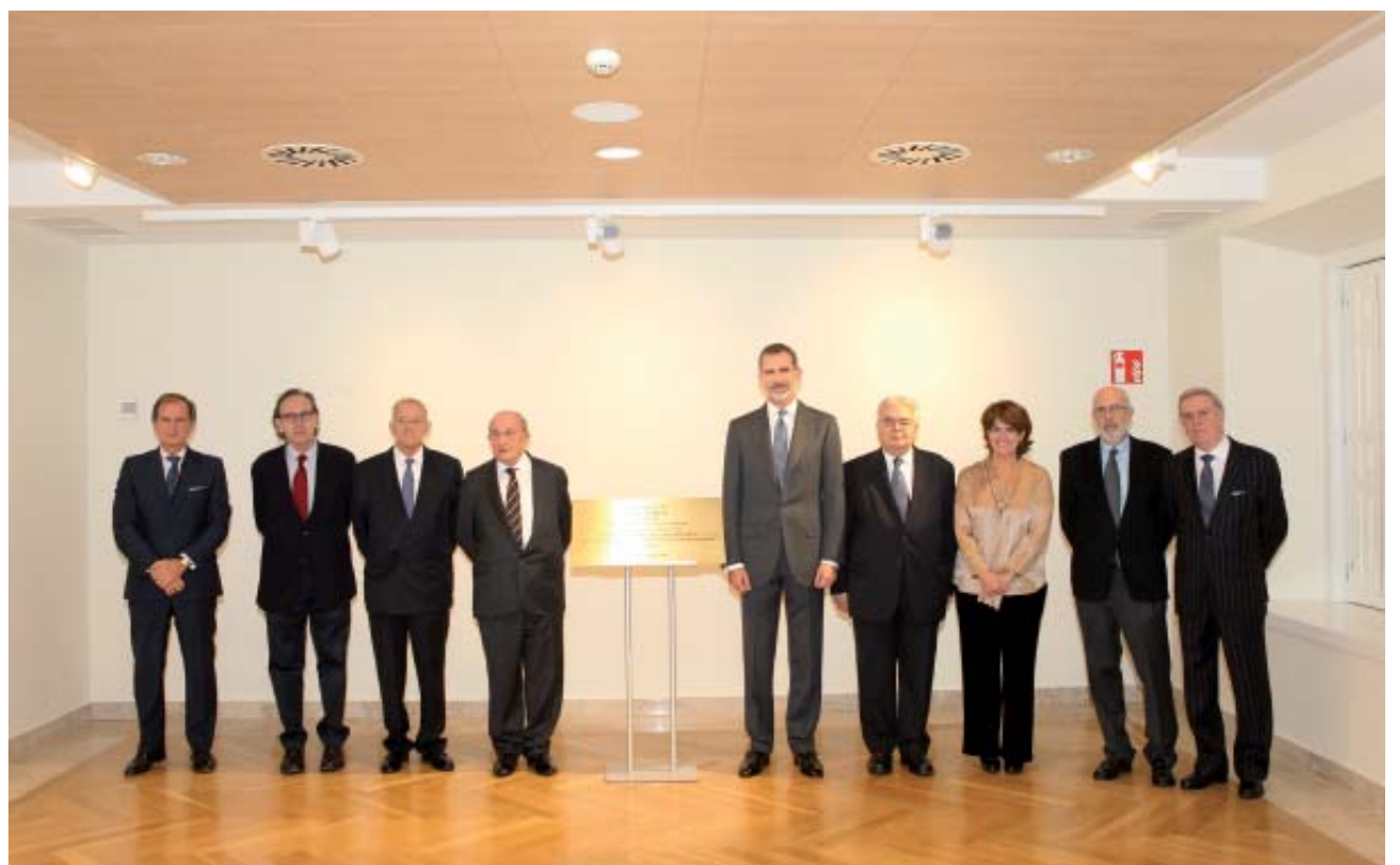
El Rey junto al presidente del Tribunal Constitucional, la Ministra de Justicia, los presidentes de la Academia y la Conferencia Permanente y los arquitectos, entre otros