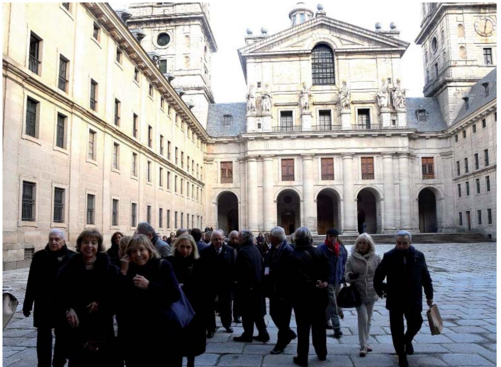
Derecha. Abandonando El Escorial para asistir al almuerzo preparado en honor de los congresistas por el Centro Universitario María Cristina