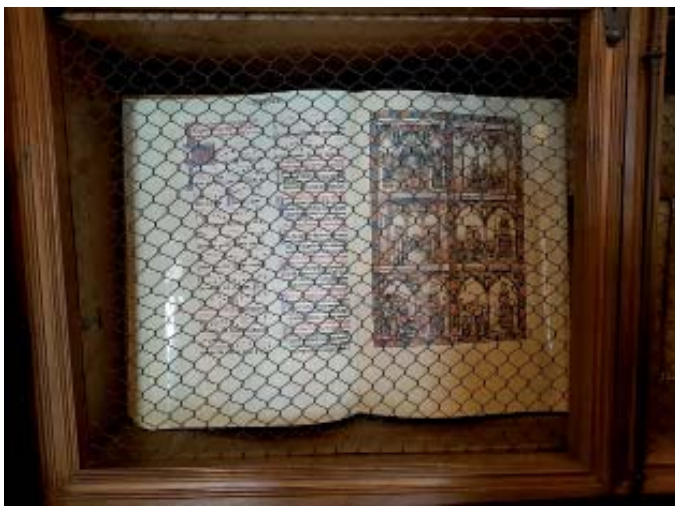
Izquierda, uno de los muchos valiosos volúmenes que atesora la Biblioteca del Monasterio