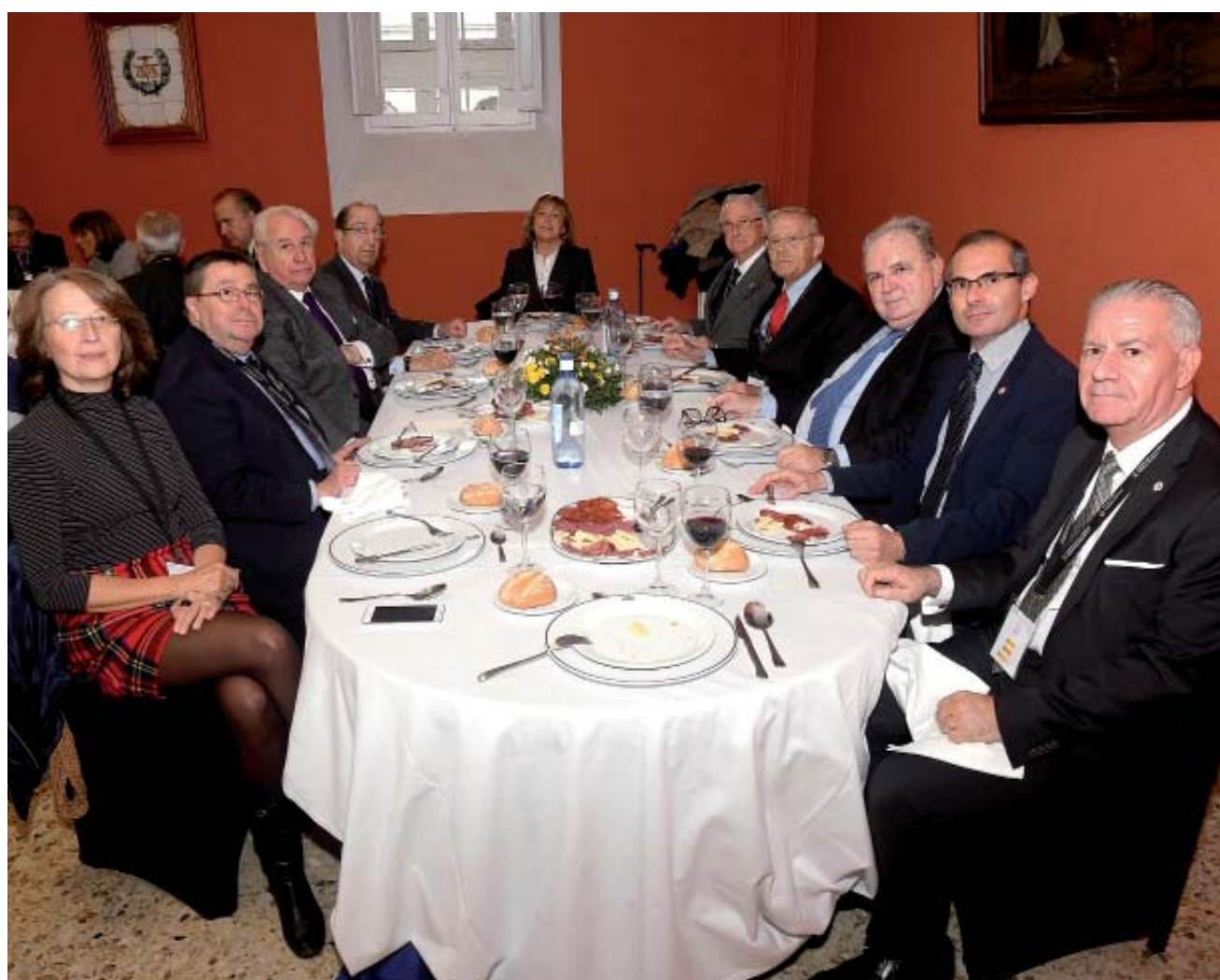
Derecha. Vista general de la mesa presidencial durante el almuerzo ofrecido a los asistentes al X Congreso por el Centro Universitario que gestionan los Padres Agustinos