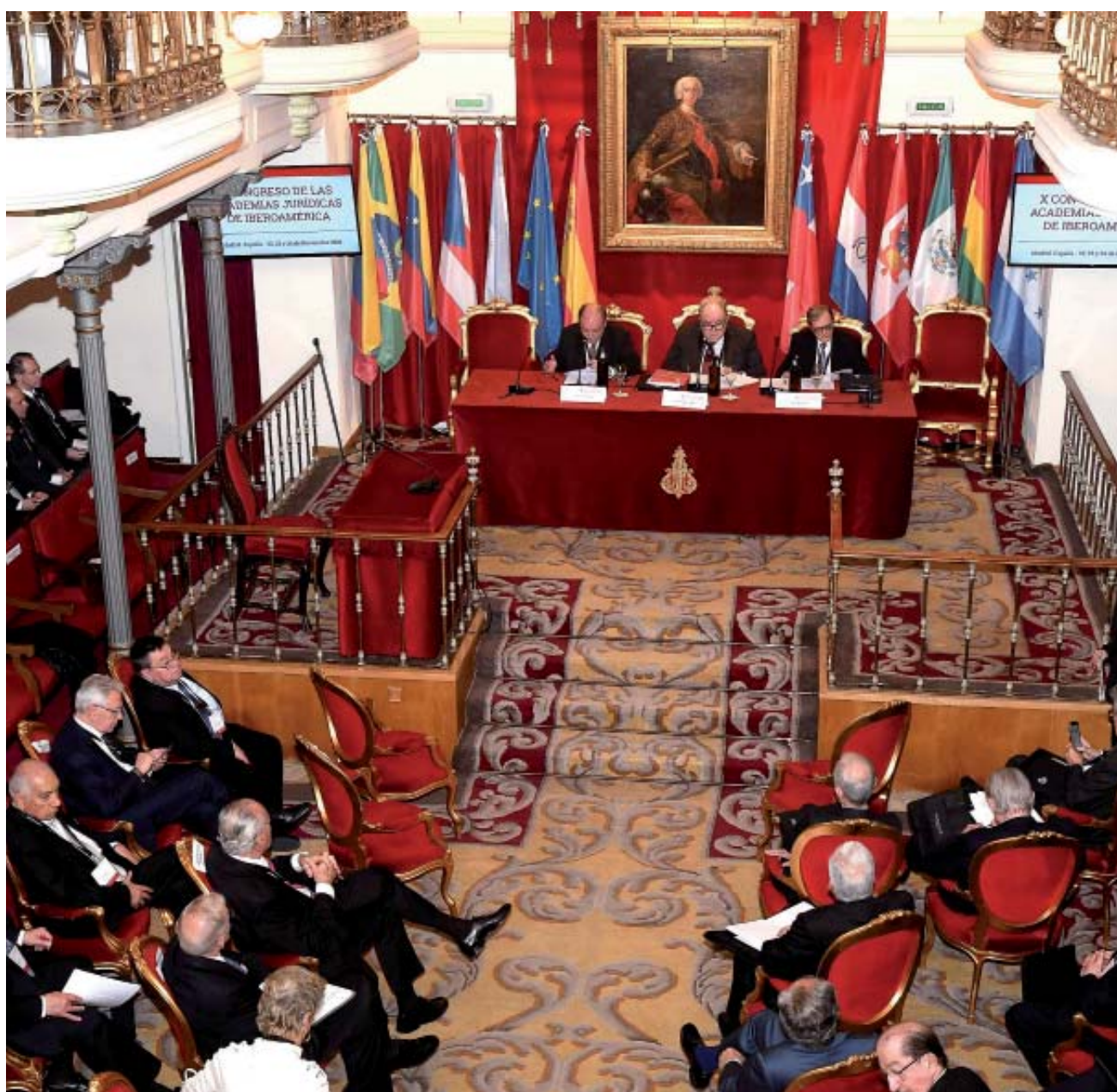
Vista general de la sala que acogió la Sección Primera

experto, la eficacia pasa por detallar constitucionalmente un Poder Judicial auténticamente independiente e inamovible, tan protegido o más en su actuación y en sus medios como el Poder Ejecutivo en los distintos niveles de gobierno.