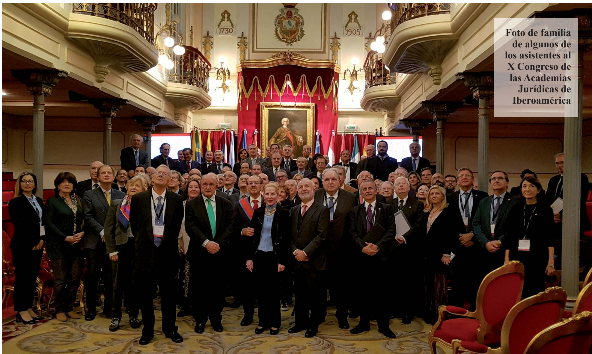
Foto de familia de algunos de los asistentes al X Congreso de las Academias Jurídicas de Iberoamérica