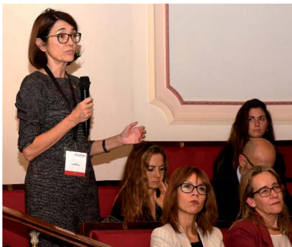
Turno de preguntas tras la mesa redonda en torno a Derecho y Desarrollo Tecnológico