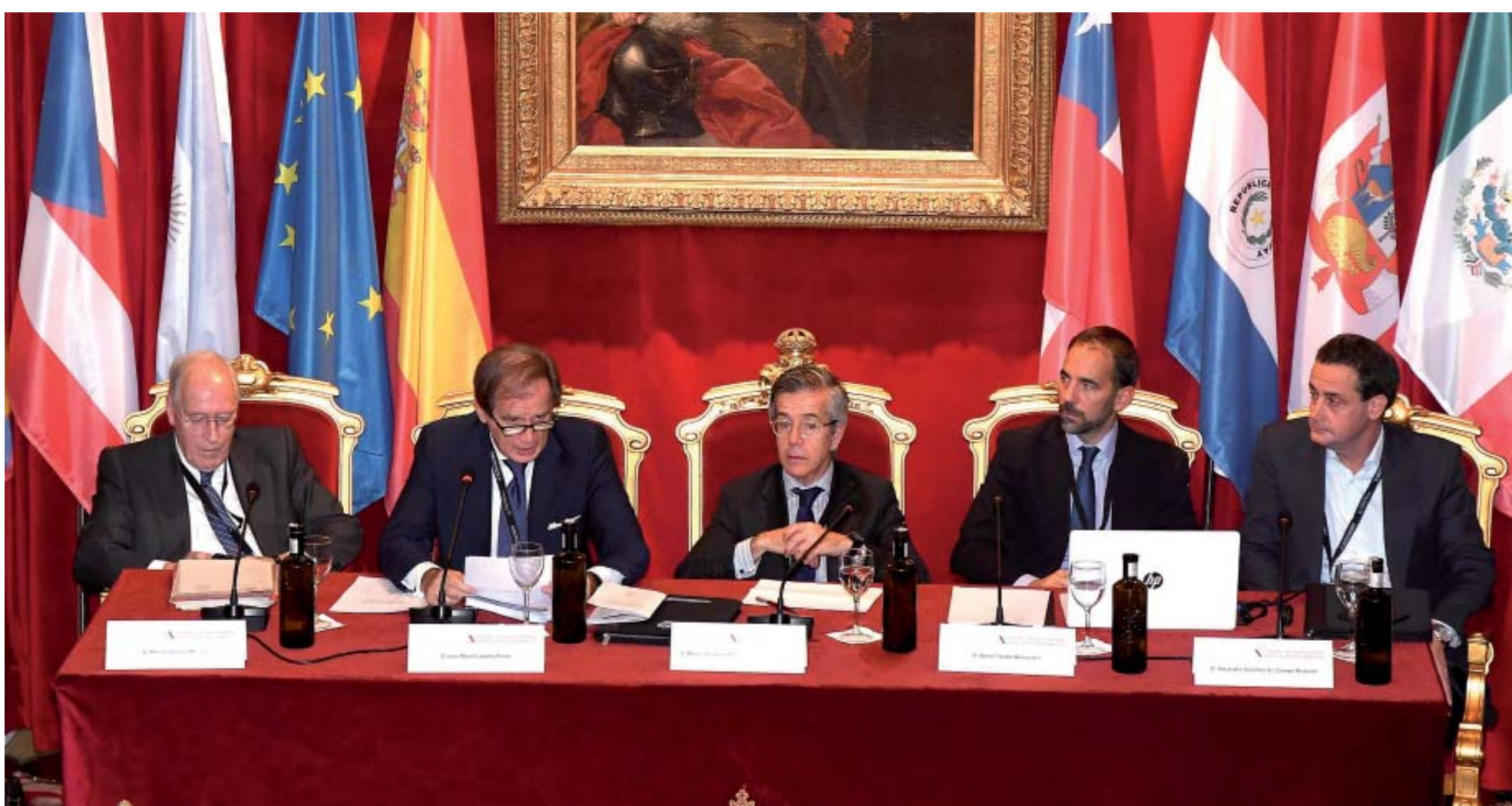
Mesa presidencial de la Sección Segunda

Criptomonedas, drones, vehículos autónomos, robotización del trabajo, smart contracts... cientos de elementos nuevos que exigen su encaje en el ordenamiento jurídico