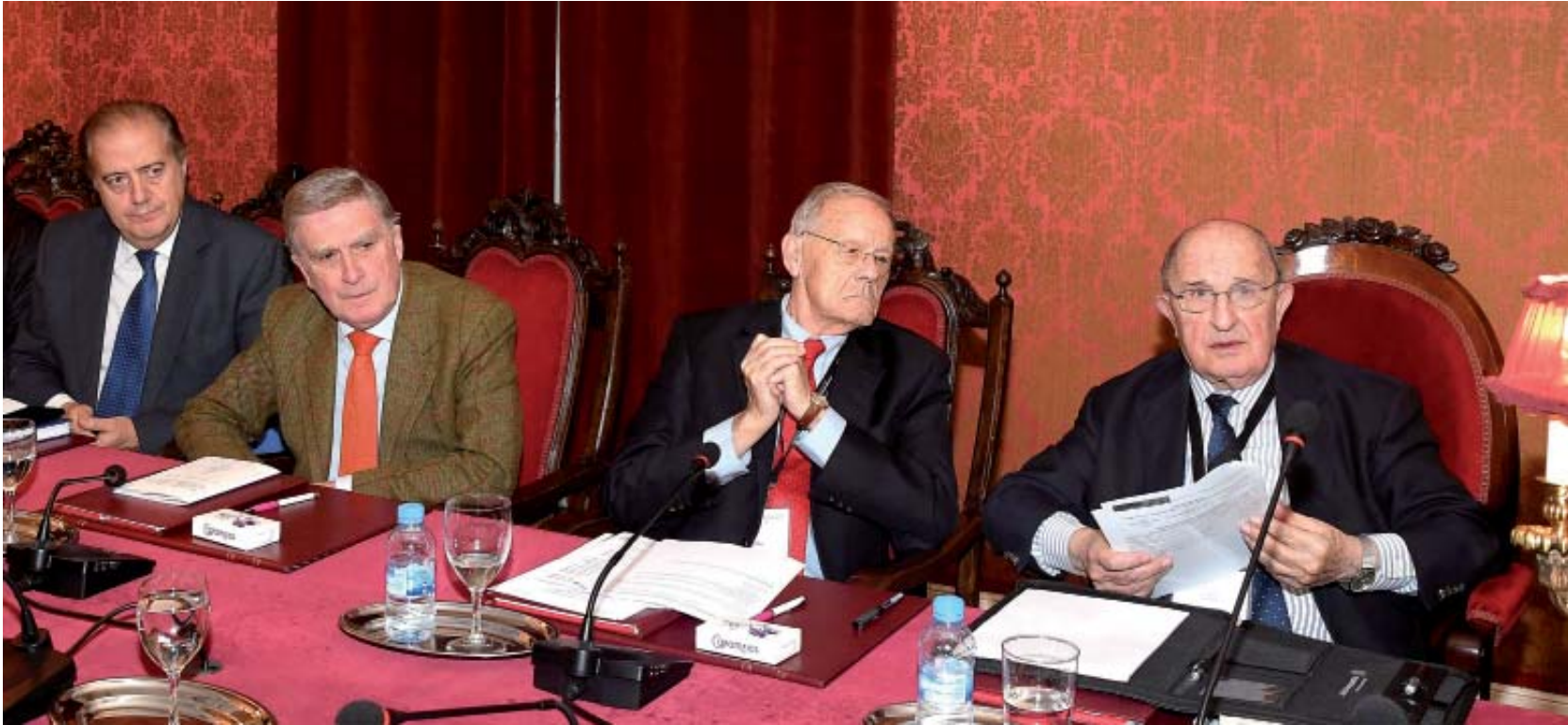
Presidentes de la Conferencia Permanente y de la Real Academia de Jurisprudencia y Legislación de España, durante el Consejo de Delegados

A iniciativa del presidente de la Academia venezolana, la Conferencia Permanente acordó la publicación de una Declaración de Apoyo a ese país, en la que los juristas exigen el restablecimiento de los Derechos Humanos y la Democracia en Venezuela