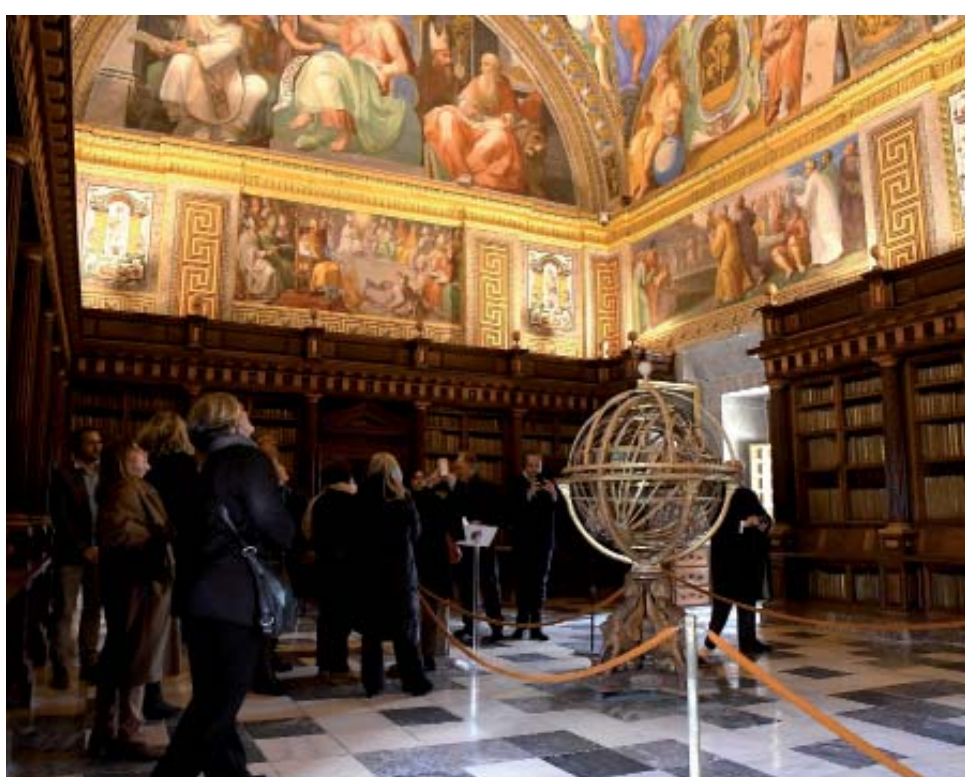
Visitando la Biblioteca de El Escorial y su espectacular bóveda

Admiraron también una de las piezas más excepcionales de El Escorial, el Cristo Blanco, que fue esculpido en una sola pieza de mármol de Carrara por Benvenuto Cellini