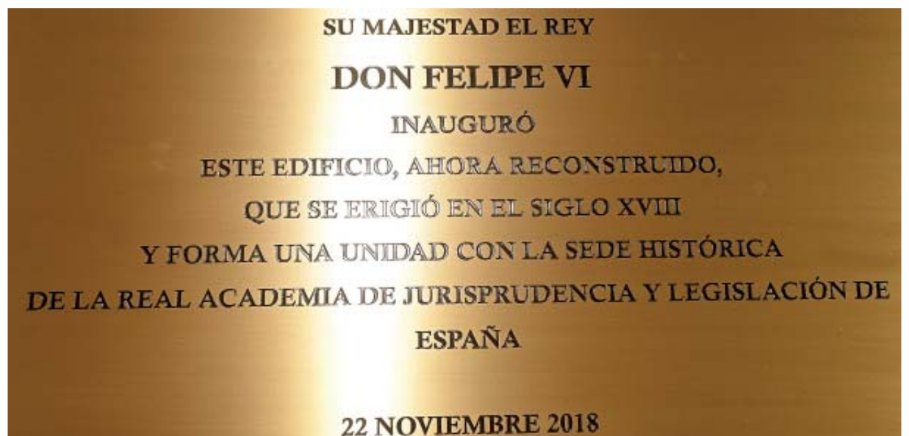
Placa conmemorativa de la ampliación de la sede de la Real Academia de Jurisprudencia y Legislación de España inaugurada por Felipe VI