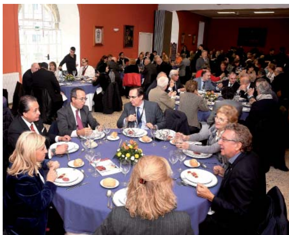
Sendas panorámicas de las mesas que ocuparon los académicos y sus acompañantes en el Real Centro Universitario María Cristina