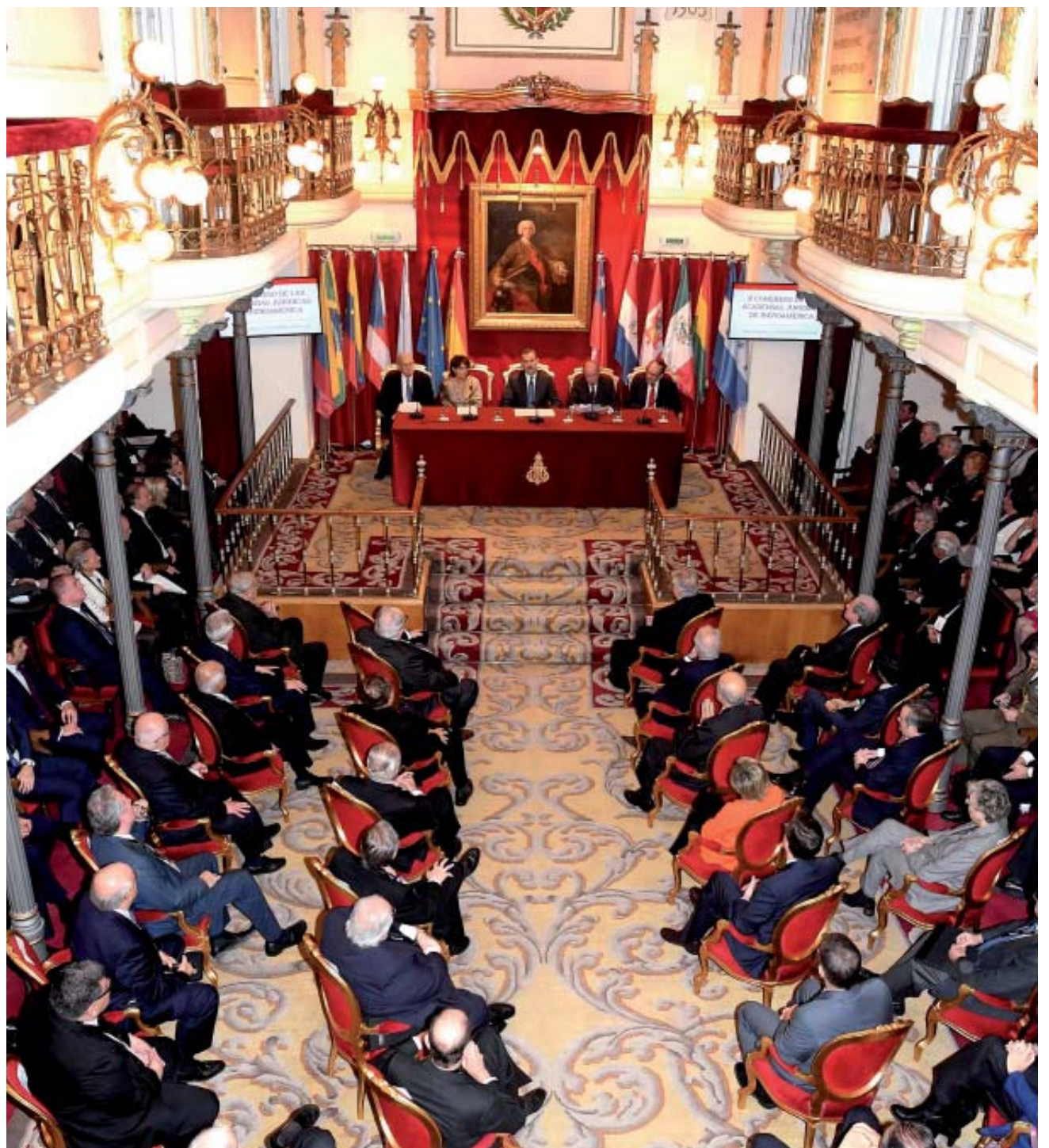
Vista general del Salón de Plenos donde se celebró la inauguración del X Congreso