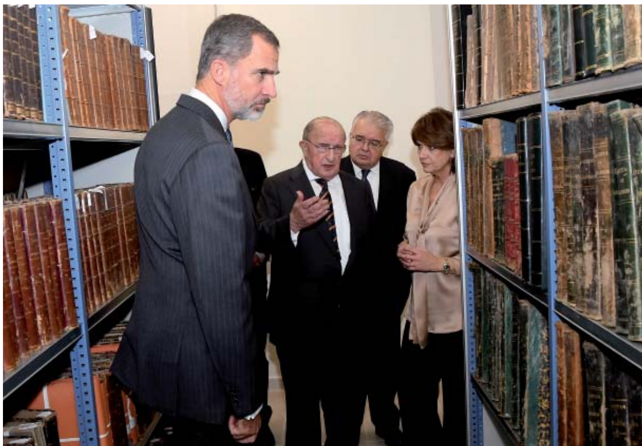
Su Majestad, la ministra y el presidente de la Academia visitan el nuevo Archivo

El nuevo Salón de Actos, inaugurado por la Sección Cuarta del Congreso, tiene un aforo de 120 personas