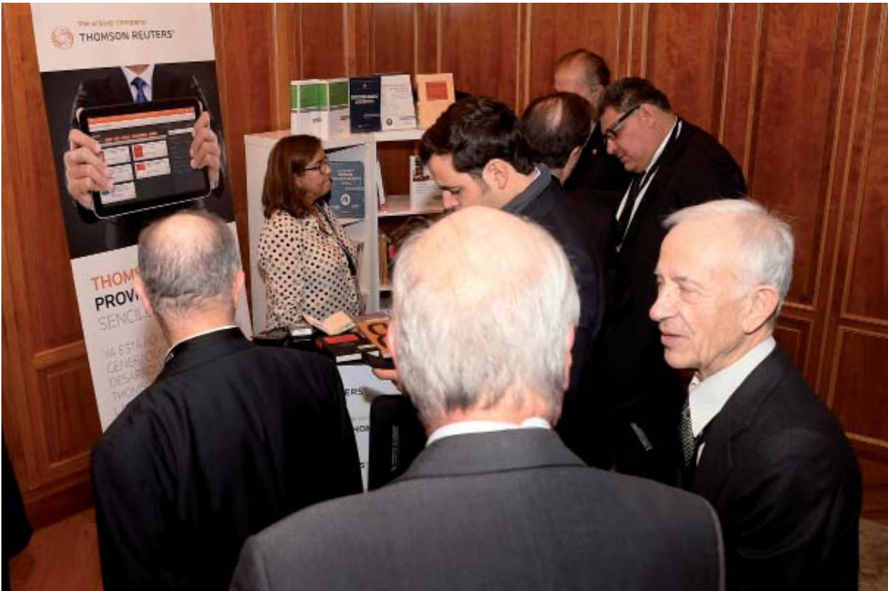
Congresistas consultando publicaciones en el stand de Thomson Reuters, uno de los principales patrocinadores del Congreso