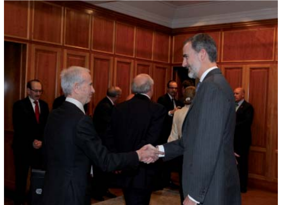
Su Majestad Felipe VI saluda a Victorio Magariños Blanco, en representación de la Academia de Sevilla