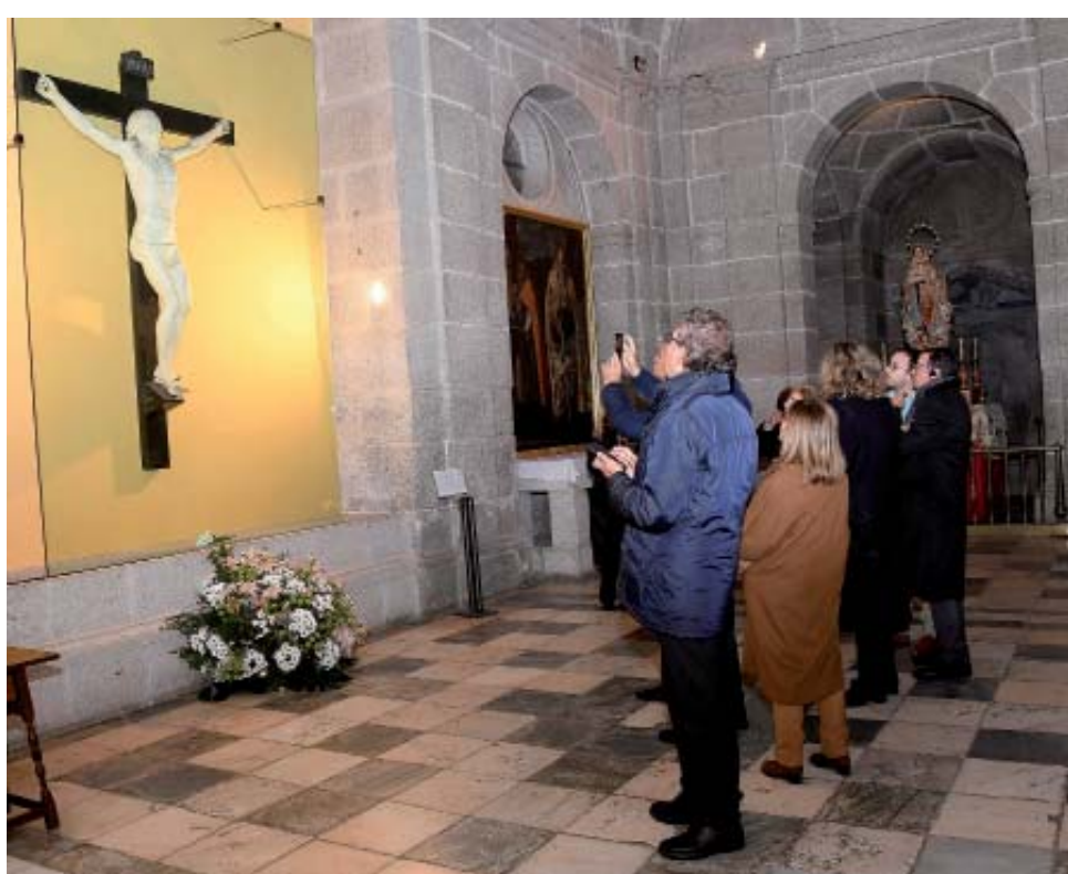
Frente al Cristo Blanco de Benvenuto Cellini

Admiraron también una de las piezas más excepcionales de El Escorial, el Cristo Blanco, que fue esculpido en una sola pieza de mármol de Carrara por Benvenuto Cellini