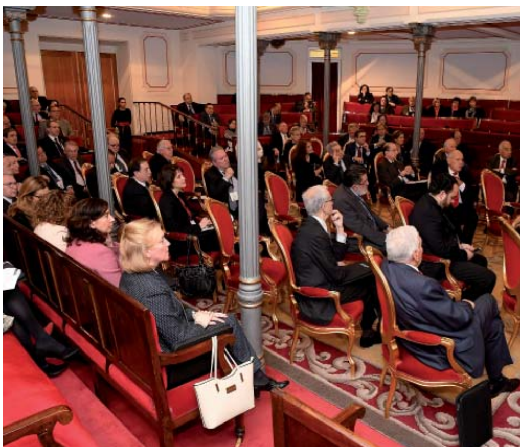
Asistentes a la sección sobre Público y Privado en el Derecho