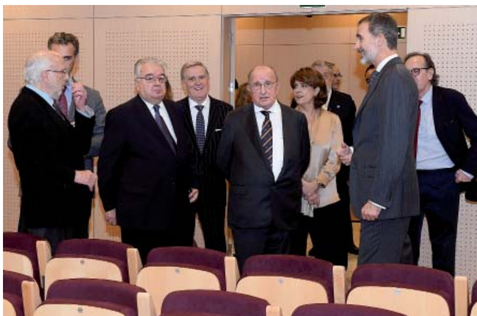
Felipe VI visita el nuevo salón de actos de la Academia donde poco después se darían cita los participantes de la Sección Cuarta