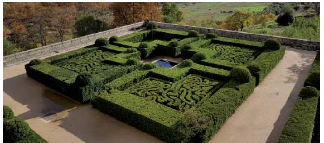
Arriba, detalle de los Jardines de El Escorial