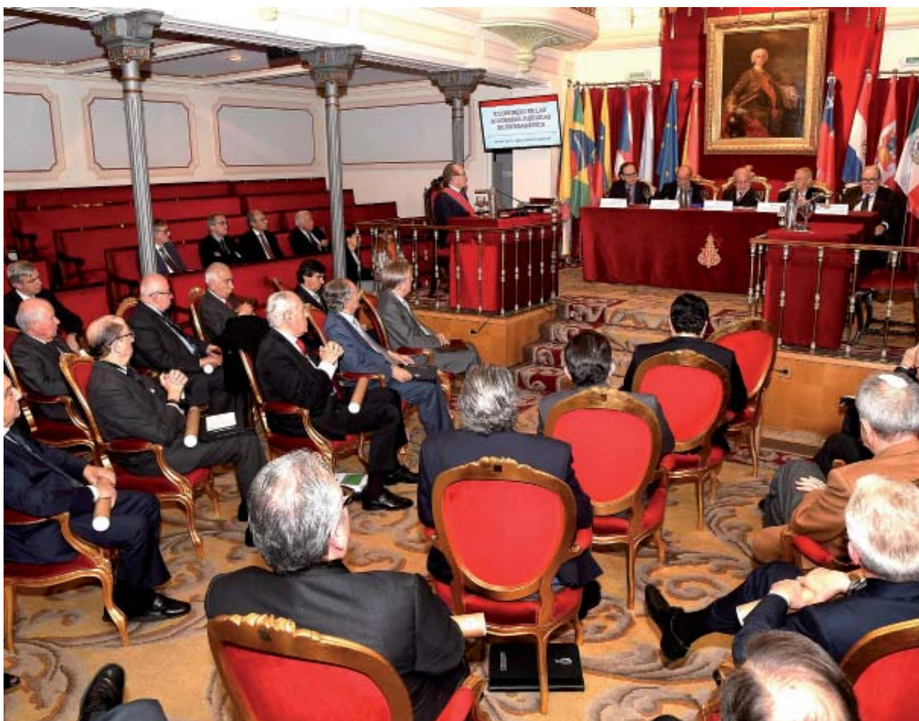
Vista general del Salón de Plenos donde tuvo lugar la sesión de clausura del Congreso

“Al marchar a vuestros destinos espero que llevéis en el corazón estos días de intercambios jurídicos, camaradería y sincero afecto”