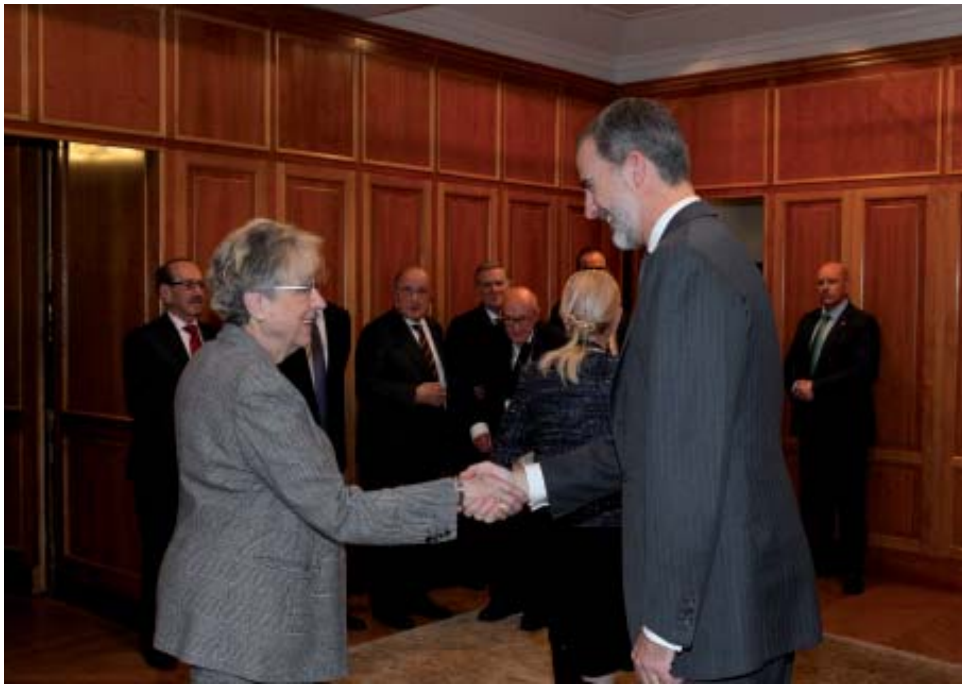
Su Majestad saluda a Encarnación Roca i Trías, Académica de Número de la RAJYL y magistrada del Tribunal Constitucional