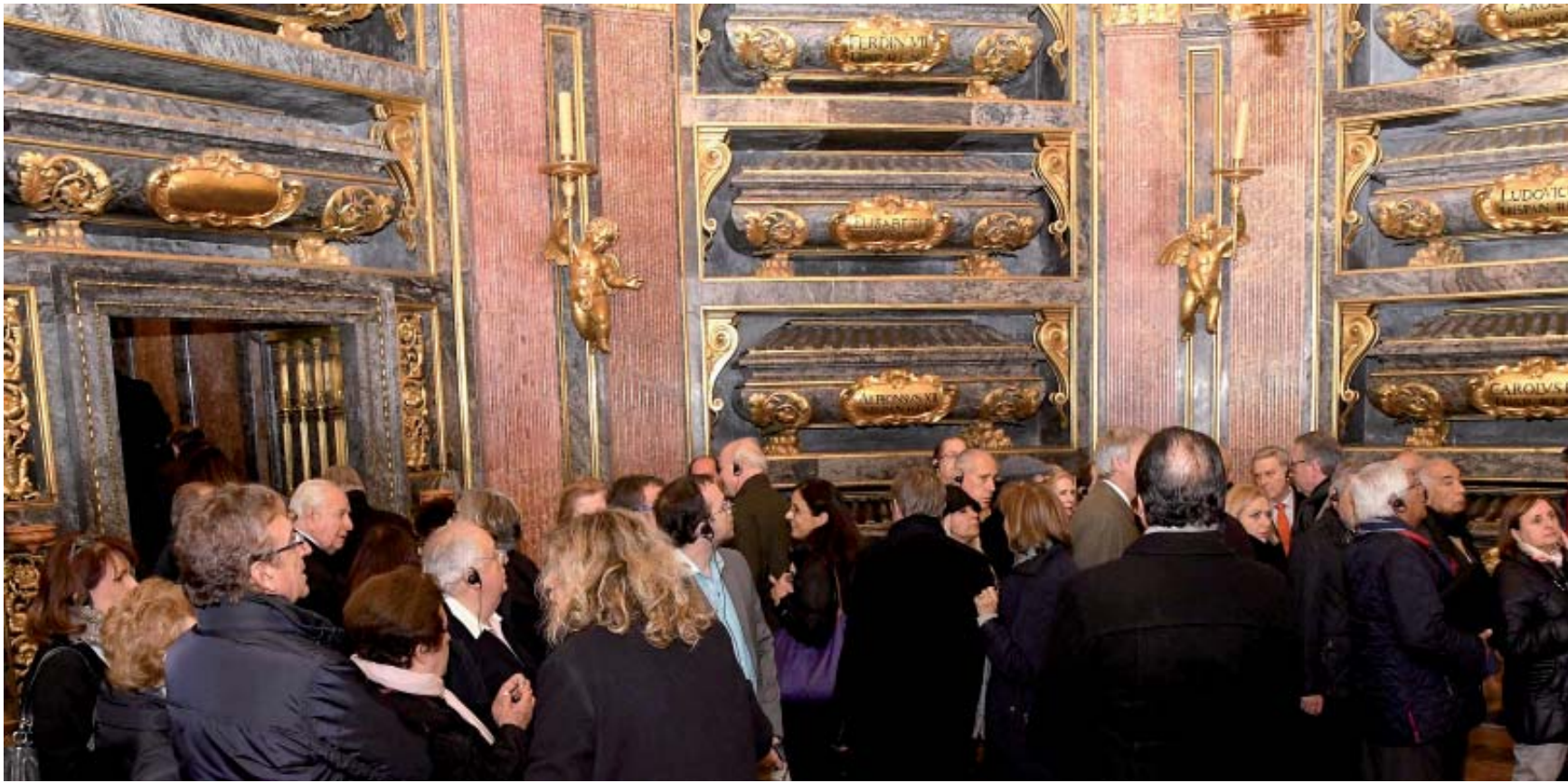
En el Panteón de los Reyes