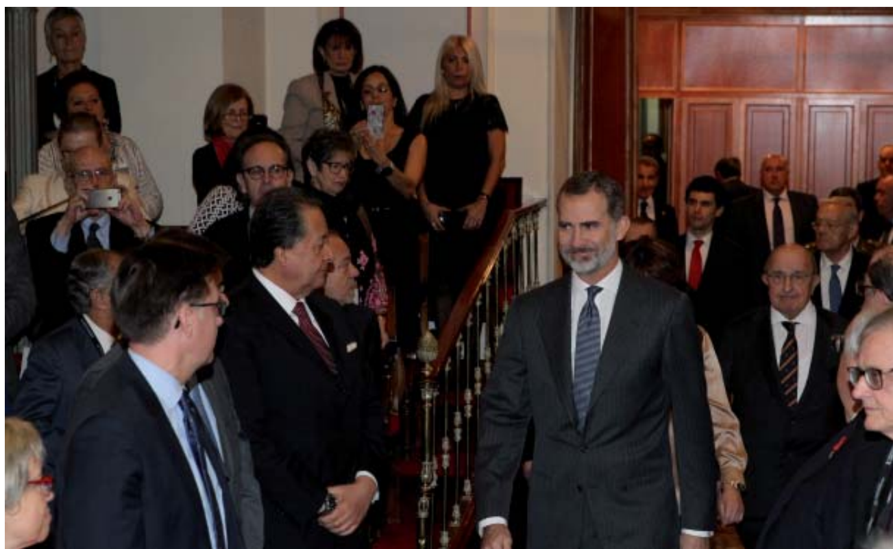
Entrada en el Salón de Plenos de Su Majestad El Rey