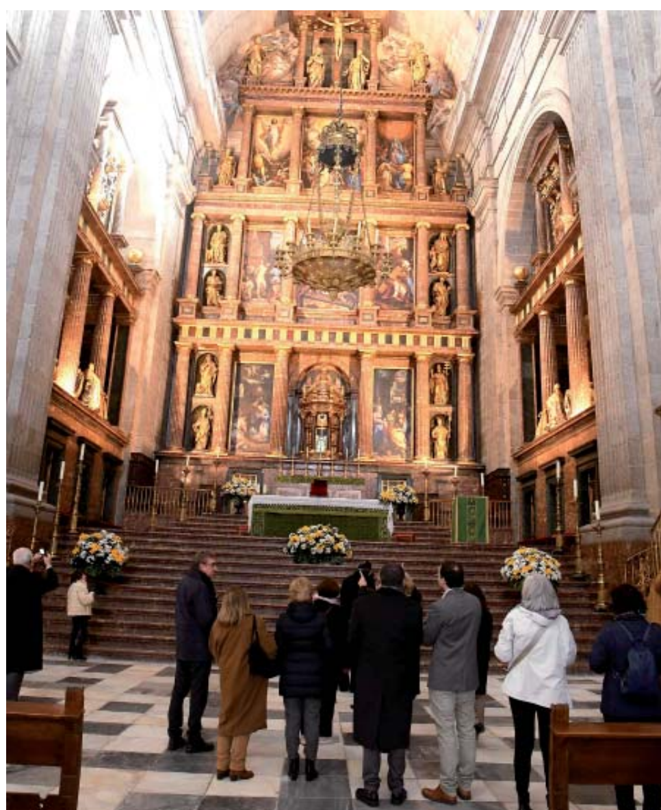
Ante el portentoso retablo de la Basílica