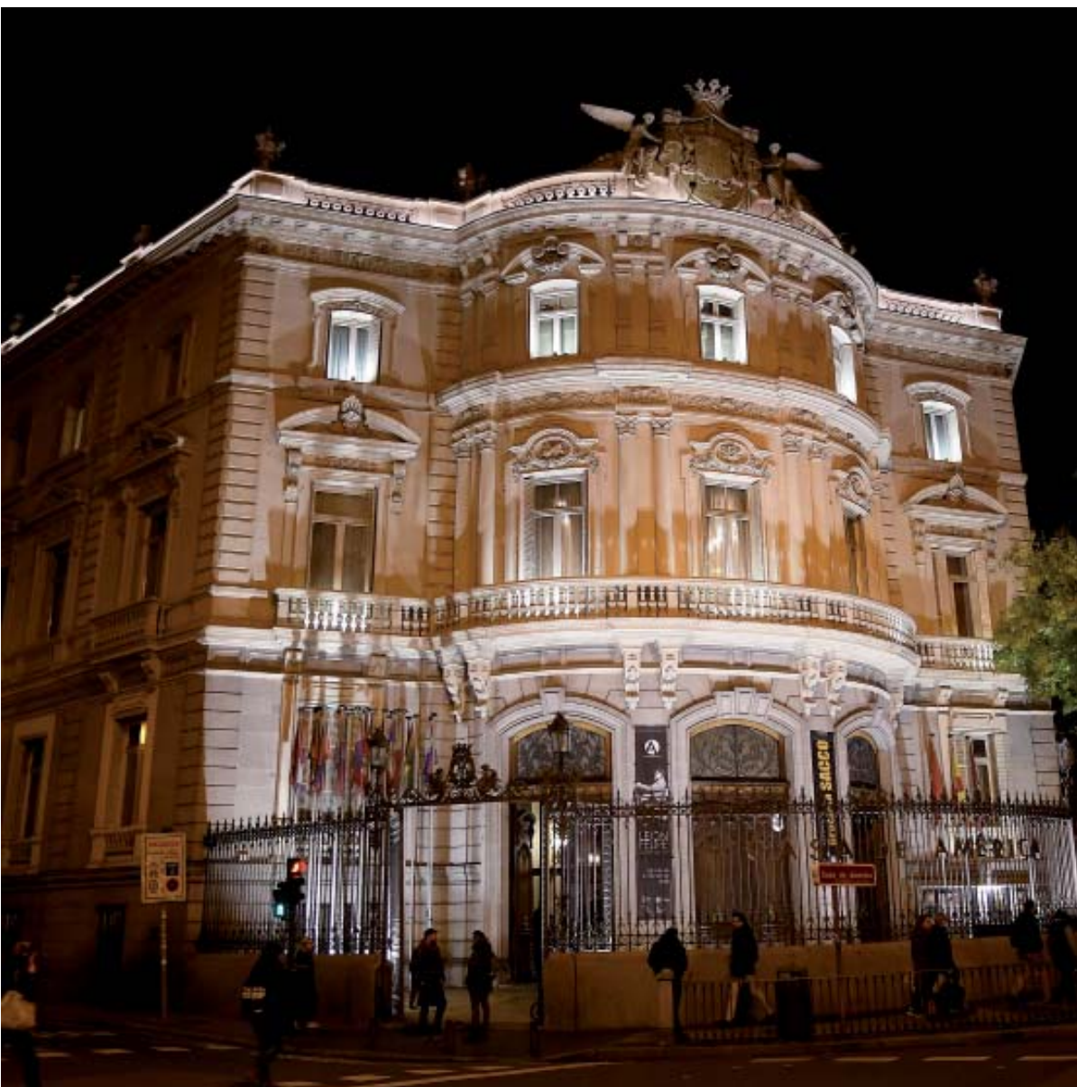
Casa de América (antiguo Palacio de Linares)